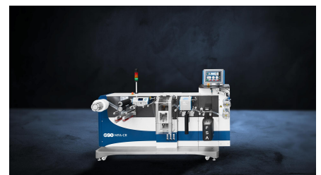
Modularer Folienanalysator (MFA)