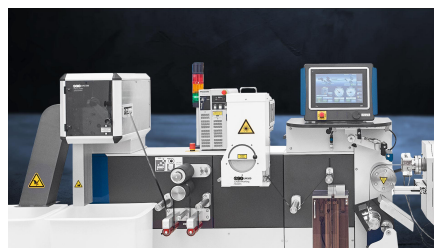
LASER Markiersystem (LM100)